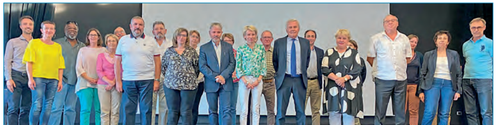
Au centre multimédia lors de son installation