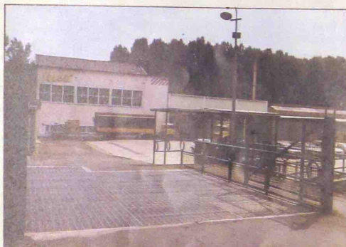
RÉFECTION DU TABLIER DU PONT.