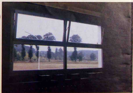
OUVERTURE DE FENÊTRE A L'ATELIER 462.