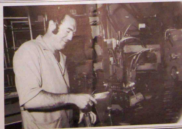
Pose de ressorts de rattrapage de jeu, pour immobiliser les doigts de la m/c en position réglée.