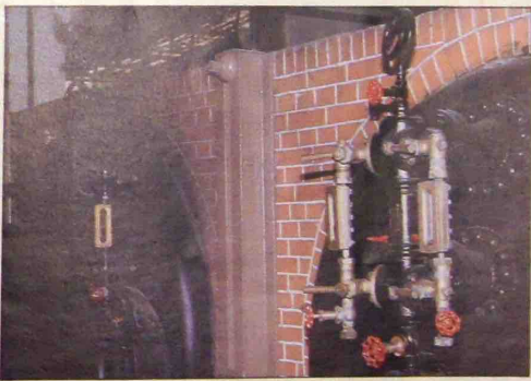
RECONSTRUCTION DE LA VOUTE DE LA CHAUFFERIE.