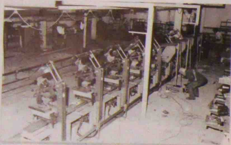
Vue de l'atelier en cours d'aménagement

C'est dans un temps record, que travaux et transfert étaient réalisés par le personnel du 700, permettant la reprise de la production dans les meilleurs délais. Félicitations à tous.