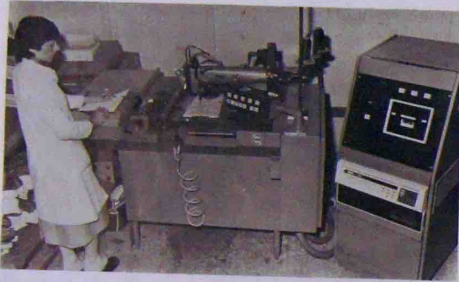
M me VERDIER, opératrice à la machine ACS-B

Enfin, un matériel optionnel supplémentaire sert à l'élaboration des programmes permettant ainsi la réalisation des opérations de piquage les plus variés.