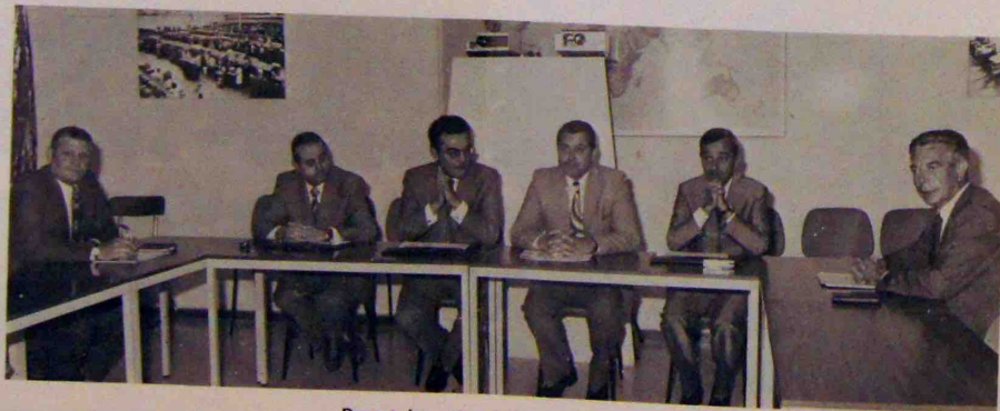
Durant la présentation audio-visuelle.

Qu'il nous soit permis de les remercier de leur visite et des conseils qu'ils nous ont prodigués.