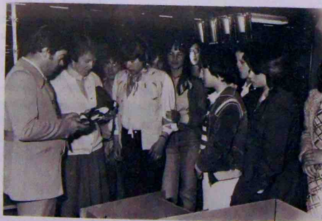
Nos visiteurs dans les ateliers.

Nous avons eu le plaisir de recevoir les élèves de première année de la section de piquage en chaussures du C.E.T. de Ribérac.