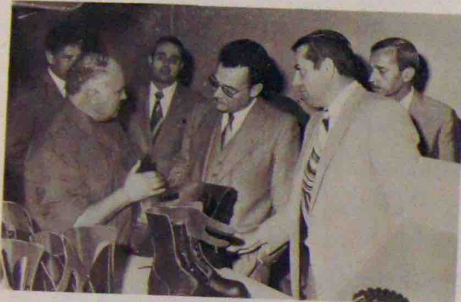
Au cours de la visite dans nos ateliers.