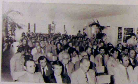
Une vue de l'assistance pendant la cérémonie

« Il se trouve que malheureusement, depuis 1974, nous sommes en récession économique, et que notre Profession est particulièrement touchée.