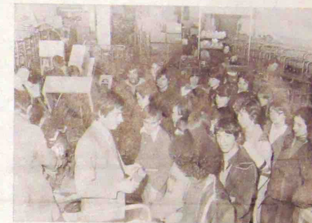
Lors de la visite des scolaires neuvicois et de leurs correspondants anglais

Les élèves des classes de 4 e du C.E.S. de Neuvic sont venus, accompagnés par leurs correspondants anglais. Ces élèves étaient intéressés à double titre; pour les uns, voir comment se fabrique une paire de chaussures, pour les autres, montrer à leurs correspondants un des pôles d'attraction industrielle de la région. Et tous, jeunes Neuvicois et jeunes Anglais, furent fortement intéressés et très attentifs à ce qu'ils découvrirent.