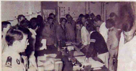
Dans la salle d'échantillons

Le mercredi 15 mai, nous avons eu le plaisir de recevoir dans notre entreprise les officiers-élèves de l'Ecole Militaire d'Administration de Montpellier, qui étaient accompagnés