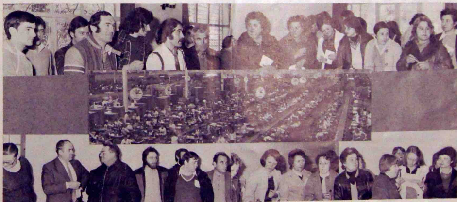
Une partie du personnel des ateliers 459 et 414 et la décoration des ateliers