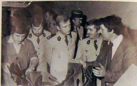
Au poste de contrôle des BM 65 à l'atelier 461

Une présentation audio-visuelle de notre entreprise, en passant de l'historique aux réalisations présentes, permit à nos hôtes de se faire une idée générale de nos réalisations.