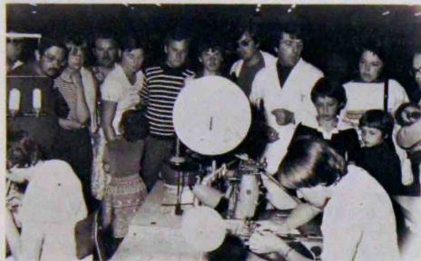
Dans les ateliers de couture

Après cette visite, qui, à leurs dires, les a fortement intéressés, la plupart nous ont déclaré qu'ils ne pensaient