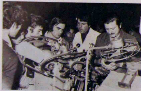
Au montage des bouts

Une vingtaine de stagiaires du centre F.P.A. de Périgueux a visité notre Entreprise.