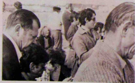
Pendant la partie de pêche

Un ronronnement de diesel, c'est le bus. 4 heures 55,