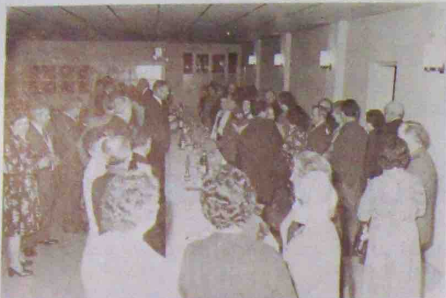
Une joyeuse animation règne pendant l'apéritif.

Le vendredi soir 6 janvier, une joyeuse animation régnait au Restaurant d'entreprise.