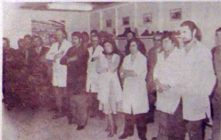
Récompenses pour les lauréats.