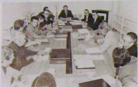
Pendant une séance de travail à Planèze

Le but en était de faire le point sur les résultats obtenus lors de la précédente campagne et de définir les nouvelles