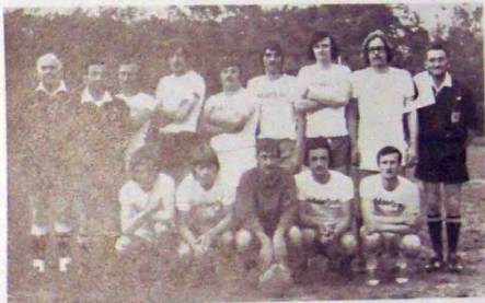
LES VAINQUEURS DE LA COUPE DUMAS