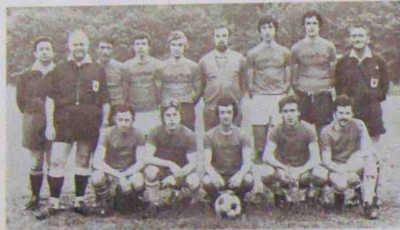
L'EQUIPE « 450 »