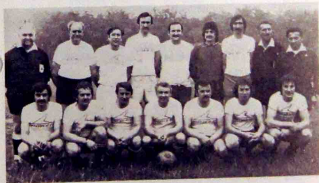
LES VAINQUEURS DE LA COUPE MARBOT