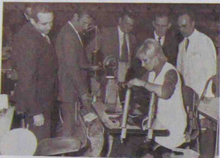
Pendant la visite de l'Atelier de couture.

Après la visite, une réunion de synthèse eut pour objet de tirer les enseignements de cette journée qui aura permis à nos hôtes de mieux connaître notre outil de travail et, nous l'espérons, d'avoir une bonne appréciation sur nos capacités de réalisation.