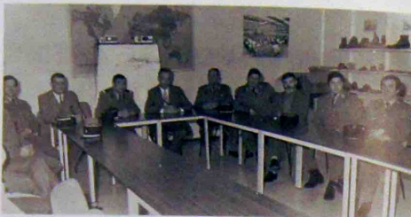
Pendant la présentation audio-visuelle de l'Entreprise.