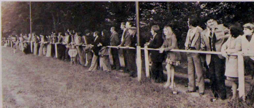
Le Public : nombreux et enthousiaste !