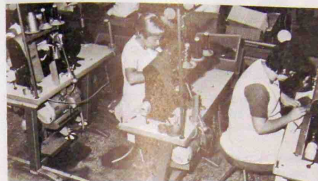
Trois des machines actuellement en service.

Sept nouvelles machines à coudre viennent d'équiper l'atelier de piquage. Il s'agit des PFAFF 491-755/03-900/01BL. Cette référence cabalistique représente une machine à pilier, à aiguille unique, qui a subi quelques modifications par rapport à ses « aînées », modifications dans le sens d'une amélioration de la précision et de la qualité du travail.