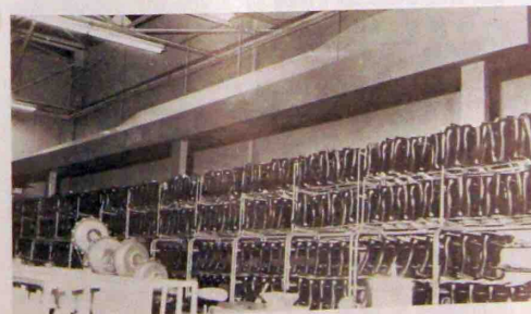
La hotte d'extraction au-dessus du mur des BM65 de l'atelier 460.

Dans le cadre du programme d'amélioration technique de l'atmosphère ambiante de Théorat, de vastes travaux ont été entrepris depuis le début de l'année. Ces travaux sont axés sur le perfectionnement de l'élimination des vapeurs en suspension dans les ateliers.