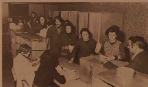
Au cours du scrutin.