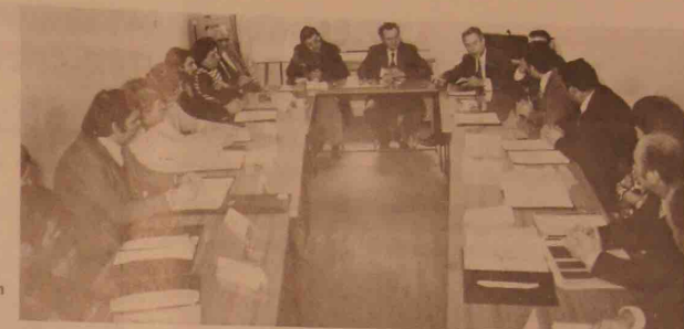
Au cours de la session de clôture.

Le vendredi 31 janvier s'est terminé le stage de formation aux « RELATIONS HUMAINES », organisé pour les Agents de Maîtrise de l'Entreprise.