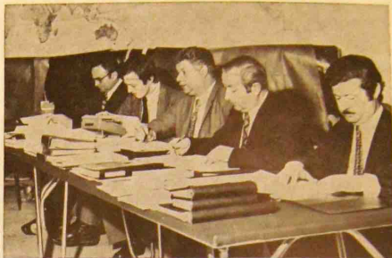
Le sérieux du travail...

Avant de commencer la campagne de prospection Automne-Hiver 73, tous nos vendeurs « France » se sont réunis du 19 au 24 février, afin d'examiner