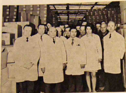
La « mise en boîtes » n'ayant plus de secret pour eux, c'est dans ce cadre qu'a posé le personnel du 680.

Tout d'abord il faut savoir que 48 personnes par-