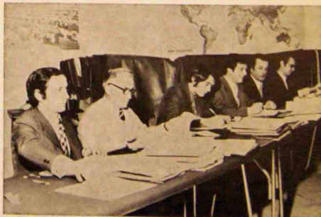
...n'exclut pas la bonne humeur.