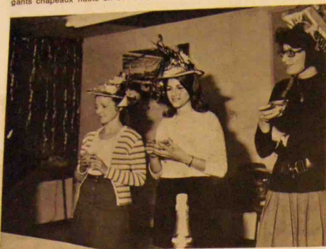
Nos trois charmantes catherinettes.