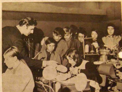
Une phase de la visite.

Les élèves de 3 e du C.E.S. de Neuvic sont venus faire un reportage sur les activités de notre Entreprise. Cette visite, soigneusement préparée par nos jeunes visiteurs, leur a permis de découvrir