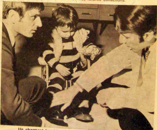
Un charmant bambin se prête de bonne grâce aux essais.

Nous les remercions pour leur aide ainsi que leurs parents qui nous ont si obligeamment « prêtés » et nous pensons que leur contribution aura une grande part dans la réussite de nos futures collections.