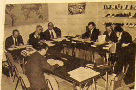
Discussions autour d'une collection : Les participants d'EUROSHOELINE pendant une séance de travail.

Pour promouvoir notre collection Automne-Hiver 1972, une importante réunion de travail a été organisée dans l'enceinte de notre Entreprise.