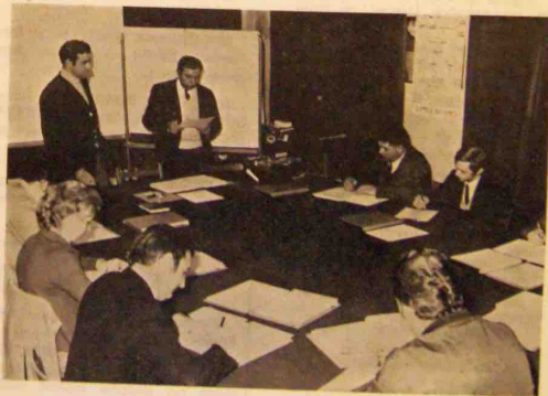
Les participants du cours A.M.A.

Gageons que ces cours de perfectionnement permettront à chacun d'améliorer ses aptitudes et d'augmenter l'efficacité de ses actions au bénéfice de tous.