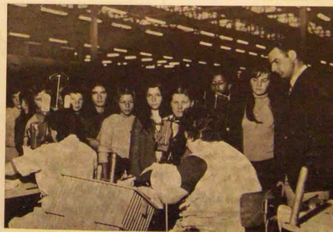
Les élèves du C.E.S. de Saint-Astier au cours de la visite.