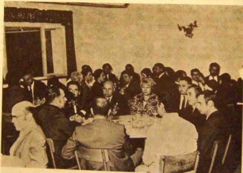
Une vue de l'assistance.

Nous lui adressons nos meilleurs vœux de réussite dans ses nouvelles fonctions.