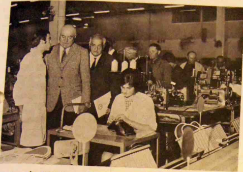
Au cours de la visite, des vignerons de la Gironde.

Le lundi 6 septembre, il nous a été agréable de recevoir le personnel de l'imprimerie JOUCLA, de Périgueux. Associés à la réalisation de Notre Bulletin, c'est avec un intérêt tout particulier qu'ils se joignirent à nous pour la visite de nos installations.