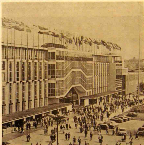
A MILAN, l'entrée du MICAM.

Septembre aura été cette année encore pour l'industrie des cuirs, le mois des rencontres internationales. MICAM à Milan et Semaine du Cuir à Paris, leur importance contribue au développement des techniques et des relations commerciales.