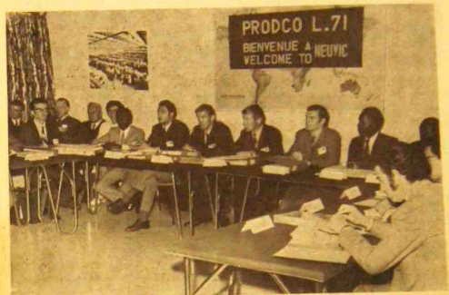
Pendant la présentation de notre Société

Pendant une semaine, Neuvic a été à l'heure internationale : en effet, nous avons accueilli les participants de PRODCO L., venant de tous les horizons.