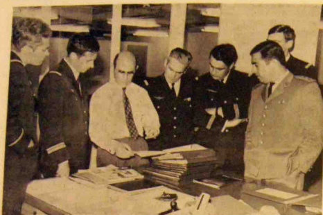
Pendant une séance de travail.

Nous pensons que de telles visites sont de nature à resserrer les liens entre les services de l'Intendance et notre Entreprise et aussi à montrer notre profond désir de toujours mieux servir cet important client.