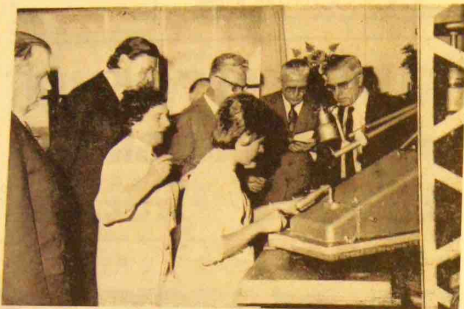
Dans l'atelier 472.

également l'objet d'une attention toute particulière de nos hôtes. Ils purent ainsi découvrir tous les travaux préliminaires au coulage des moules et assister