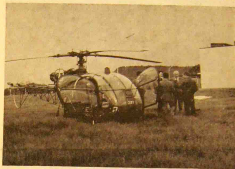
L'arrivée de l'hélicoptère.

brication du Goodyear, chaussure destinée à l'Intendance militaire.