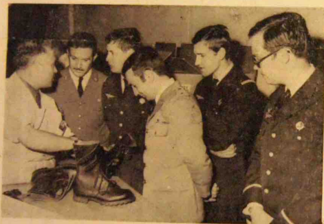
A l'atelier 460, lors de la visite.