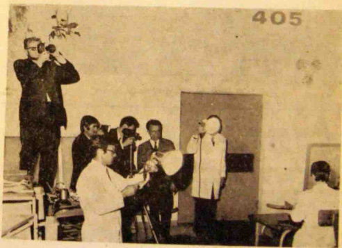
Au parage, lors du tournage du film.

activités du Commissariat de l'Air, sera projeté devant 300 personnalités à l'occasion du 25 e anniversaire de cet organisme.