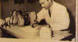
et c'est une grande chance pour lui. A Neuvic, il a fait bien travailler. Nous garderons la souve-

Nous lui garderons nos sentiments avec l'espoir que lui-même osera se rappeler sans plaisir cette demi-année de sa vie passée à Neuvic.