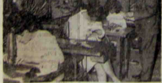
Le travail des piégoniers est observé par M. P. Bourland.