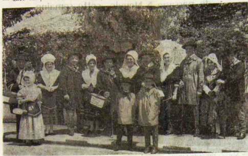
Résurrection dans le Camp du temps passé où nous ramènera, corps et âmes, la féerie joyeuse du 3 juillet.