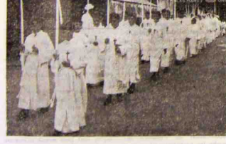
La cérémonie de la Première Communion.

défilé était impressionnant : tous ces jeunes garçons et toutes ces jeunes filles en robe blanche dans ce clair matin du mois de juin... Il y a eu le rassemblement familial de la paroisse entouré de ceux qui ne sont plus « petits » désormais et qui se sont engagés.