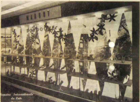
Semaine Internationale du Cuir

Le montage soudé des bouts et des flancs s'est généralisé et la majorité des constructeurs présentent leurs machines avec cet équipement complémentaire.