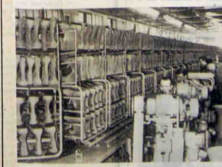
De mur de chaussures montées, ayant émerveillé tant de visiteurs, se mesurent si discrètement qu'il faut bien l'observer pour le voir vivre son circuit.

Bien sûr, sa masse imposante sera remplacée par une nouvelle production qui, si elle ne comporte pas de chariots aussi volumineux, n'en sera pas moins attrayante.