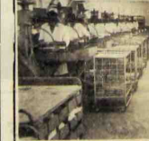
Une récente vue partielle de l'atelier « 405 »

Puisent, les jeunes qui montent, s'arrêter souvent devant les noms inscrits sur les monuments, et adresser à ceux qu'ils rappellent, leurs pensées, les plus émus en témoignage de leur vénération et de leur reconnaissance !