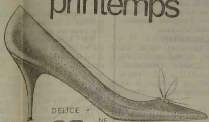
DELICE NF 26,90