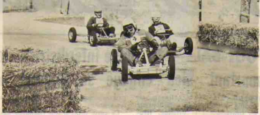
Les concurrents de la finale dans un passage difficile.

Qu'il nous soit permis de souligner la parfaite organisation matérielle de cette démonstration dont le mérite revient à notre société qui, dans les moindres détails avait eu le souci de résoudre les problèmes, de sécu-