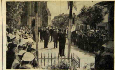
Les personnalités et la foule pendant la minute de silence devant le Monument aux morts.

on de la Fête du Travail. Rien n'avait été négligé pour qu'elles connaissent le succès. Seul, le mauvais temps aurait pu en empêcher, mais ne se produisant pas, le soleil s'était levé tôt, prometteur, et si le vent du Nord affaiblissait ses rayons, par contre, toute idée de pluie pouvait être écartée ce qui explique l'affluence dans les murs neuvicols malgré l'heure mati-