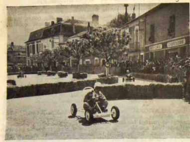
De l'Inédit à Neuvic. — Pour la première fois, en effet, notre localité fut le théâtre d'une très attrayante et très réussie démonstration de Karting.

Par tirage au sort, quatre conducteurs participent au premier départ et effectuent les 32 tours de circuit dans un temps qui varie à chaque tour entre 24 et 27 secondes et leur (Voir la suite en 3 e page)