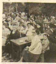
La foule était nombreuse sur les touches.

Malgré le temps frais la buvette connaît l'affluence.