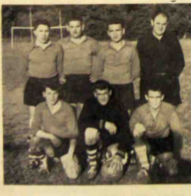
Equipe de foot-ball (vainqueur)