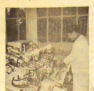
Machine à double tête

Il n'est plus en persuader de d'essayer de séparer deux pièces unies après préparation rationnelle par de la colle « 600 » entre autres; si l'on exerce une tension suffisante, on constatera des déchirures qui entraineront des lambeaux de l'une ou l'autre pièce et non une séparation franche.