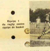
Equipe 1 du rugby contre équipe de basket