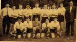
Equipe première de football, photographée lors du match Neuvic-Montpon.

DIMANCHE 2 SEPTEMBRE, à 16 heures EN CHAMPIONNAT 1 re DIVISION, AU STADE DE PLANEZE, NEUVIC RENCONTRERA LES EQUIPES 1 et 2 DE MUSDAN. YENEZ NOMBREUX EN COURAGER NOS JEUNES QUI S'EFFORCENT DE VOUS SATISFAIRE.