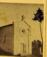
Le clocher de la chapelle de Saint-Front de Prodeux.

MOBIER L'église conserve un reliquaire en bois sculpté, du xviii e siècle ; une statue de la Vierge, en bois sculpté, du xviii e siècle ; un stuc en bois sculpté, du xviii e siècle, qui une table mutilée du xviii e siècle, en mauvais état, figurant la Cène.