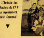
L'Amicale des Anciens du CAP a joué le jeu du jeu. C'est le samedi 30 février que l'Amicale des Anciens du C.A.P. a organisé son bal paré et masqué.

C'est le samedi 30 février que l'Amicale des Anciens du C.A.P. a organisé son bal paré et masqué. Cette soirée remporta un succès encore plus vif que celle de l'an passé. Chacun des participants était invité dans le choix et la réalisation de son costume.